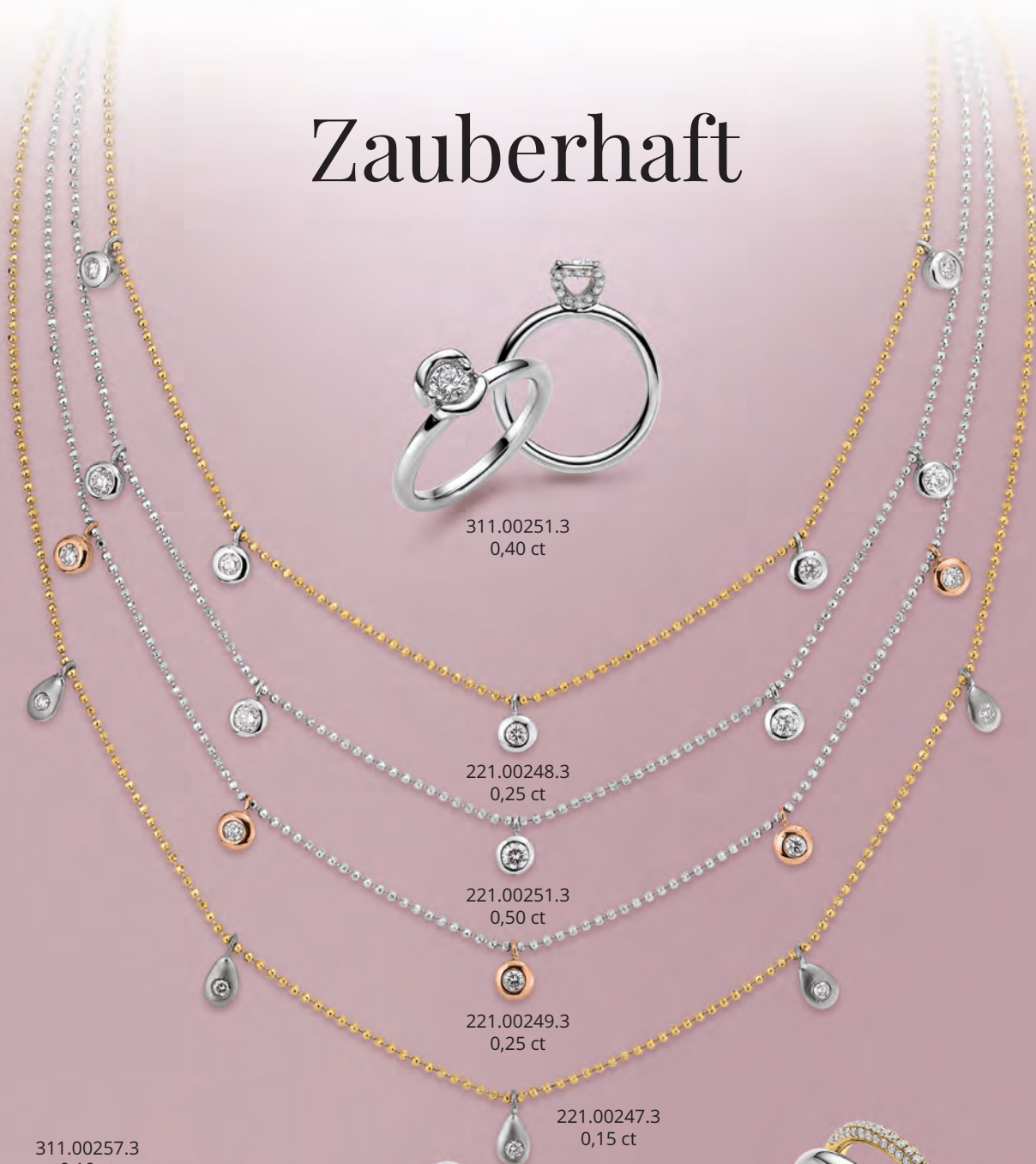
221.00248.3 0,25 ct