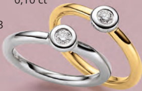
311.00258.3 0,10 ct