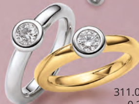
311.00255.3 0,25 ct