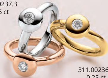
311.00237.3 0,25 ct