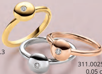
311.00248.3 0,05 ct